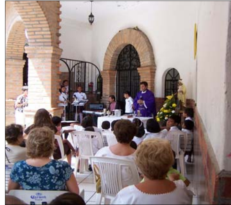
On Saturday, March 10, the local priest held a celebration to honor the 6th anniversary of the Refugio's founding.

Gran comienzo para 2007 Children's Shelter of Hope Foundation durante los pasados meses nos han dejado ayudar a Refugio Infantil Santa Esperanza con los siguientes gastos: